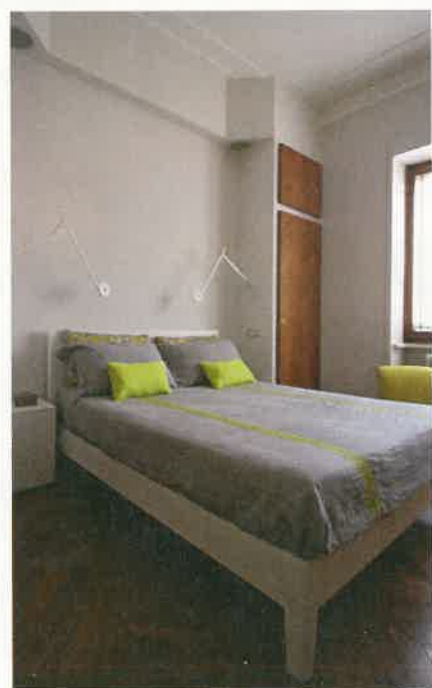
Arch Nouveau Studio